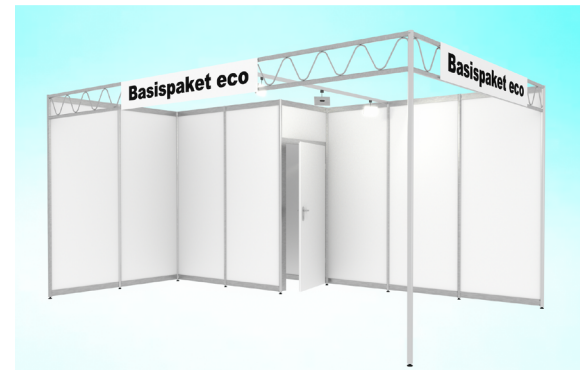
Abbildungen: Musterzeichnung Eckstand 15 m 2