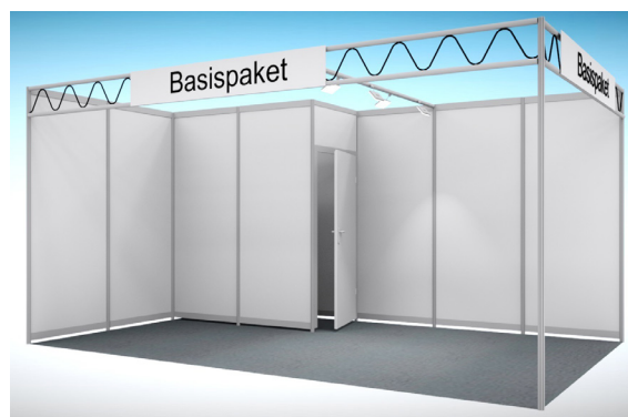
Abbildungen: Musterzeichnung Eckstand 15 m 2