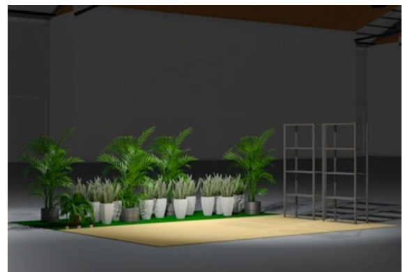
Abbildungen: Musterzeichnung 15 m 2