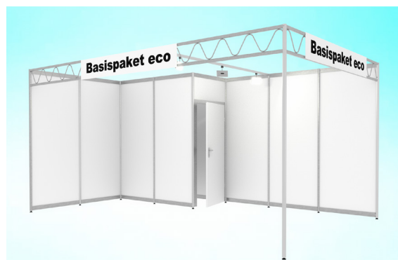
Abbildungen: Musterzeichnung Eckstand 15 m 2