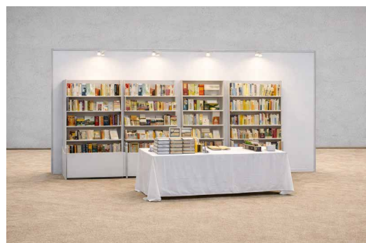
Abbildungen: Lese-Stand 12 m 2