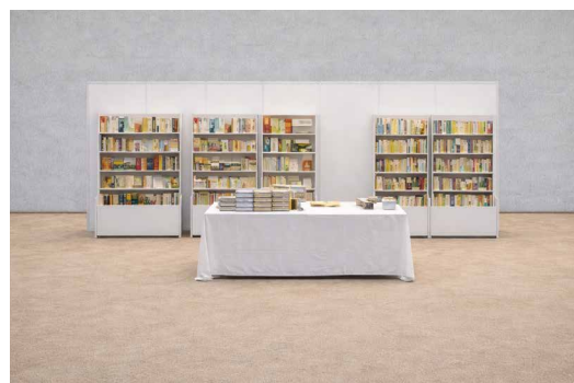
Abbildungen: Lese-Stand 25 m 2